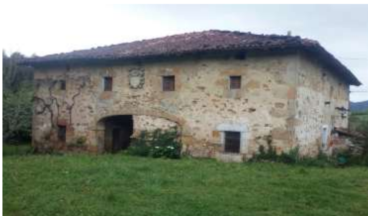
La casería Estakasolo, actualmente, en el barrio de Miñota -Elorrio-. (Igor Basterretxea)