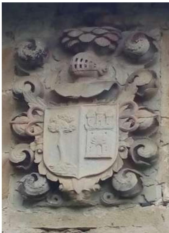
Escudo Estakasolo en la casería homónima, con la cruz de Santiago.