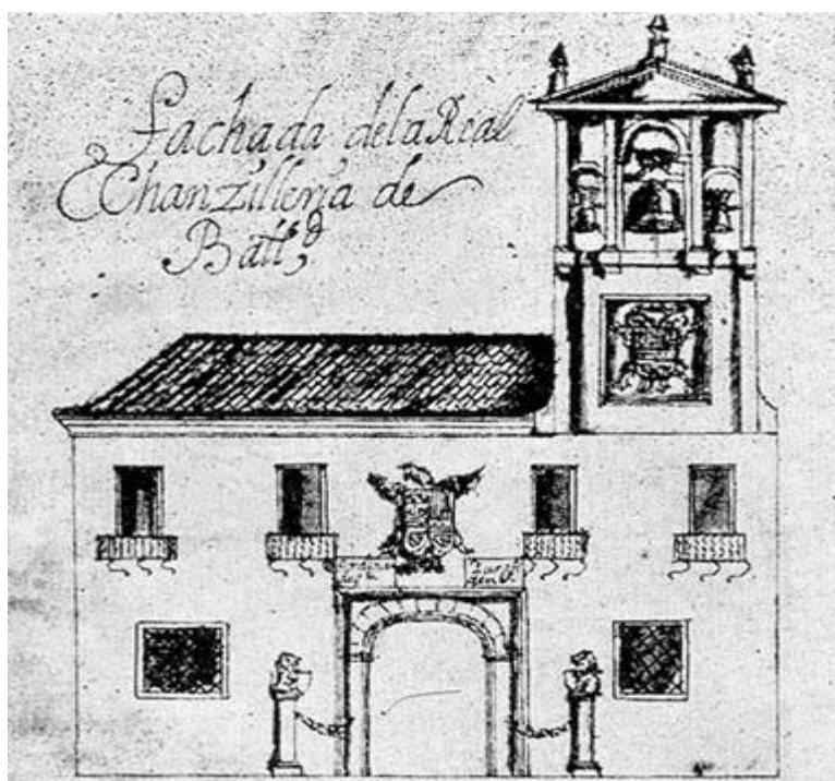
Fachada de la Real Chancillería de Valladolid en el siglo XVII.