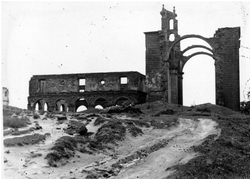
Ruinas del convento franciscano de San Andrés de Muga.