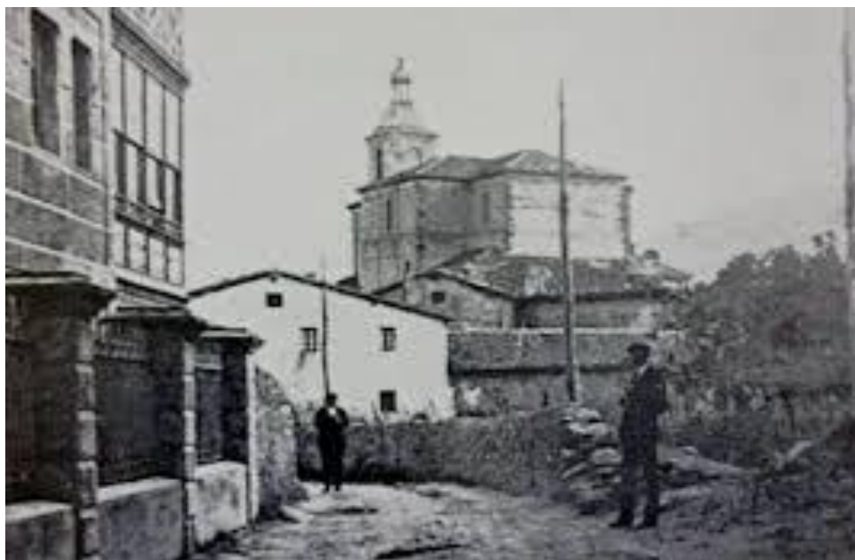
Foto antigua, de 1920, que muestra la iglesia de San Román de Zierbena.