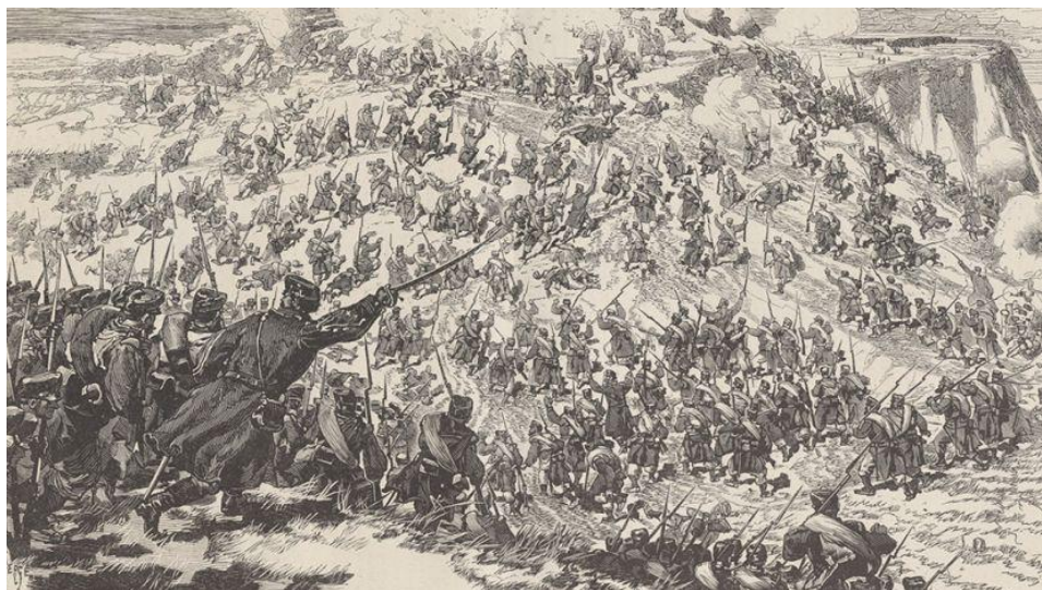
Última batalla de Montejurra, el 17 de febrero de 1876.

El 28 de febrero de 1876, como es bien sabido, se da por finalizada la tercera guerra carlista 1 , al ser ese el día en que, por un lado, el pretendiente don Carlos 2 cruza la frontera de los Pirineos en retirada hacia Francia y, por otro, Alfonso XII 3 entra triunfante en Iruñea/Pamplona. Para que ello fuera así, cabe recordar que, pocos días antes, se habían producido dos hechos decisivos en la mencionada guerra: la derrota por parte carlista en la última batalla de Montejurra, el 17 del mismo mes, y la conquista de Estella 4 , el día 19, a manos de los liberales.