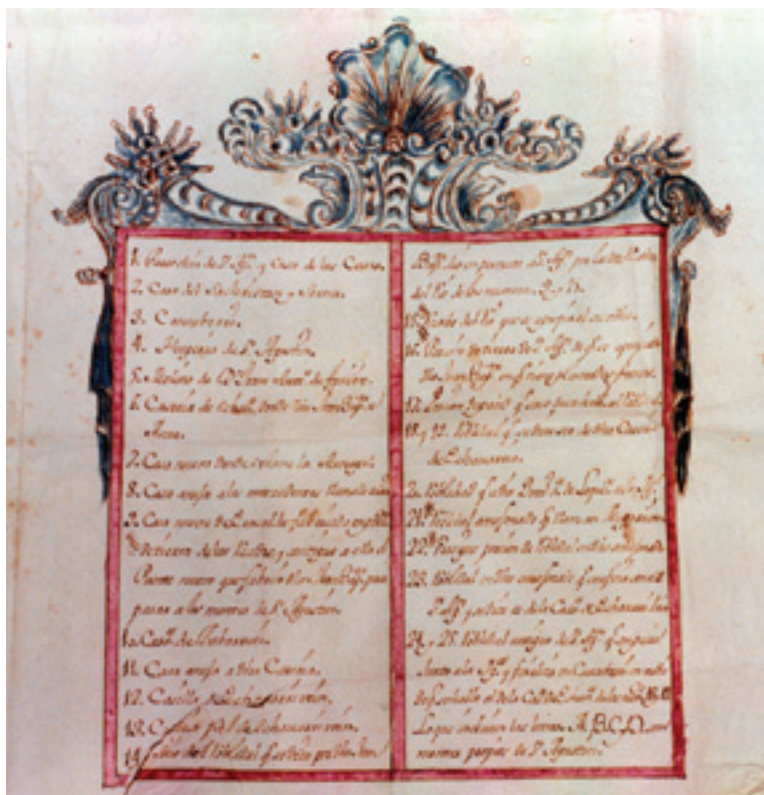
Plano berberaren detailea.