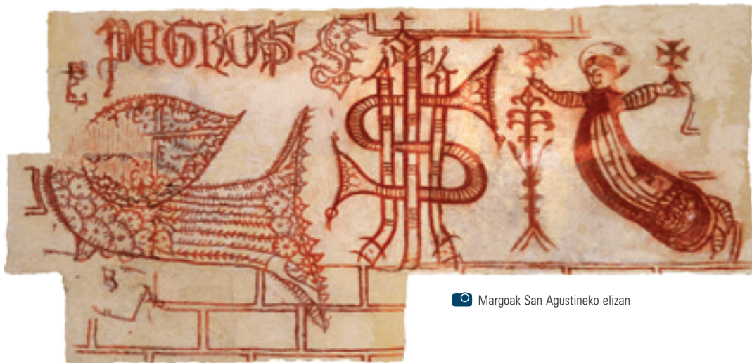
Margoak San Agustineko elizan