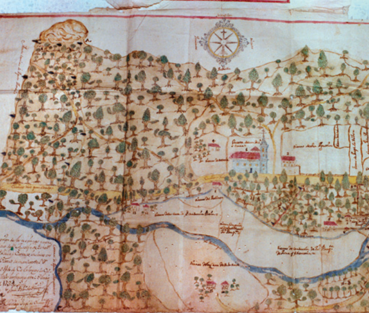
San Agustineko plano zaharra (XVIII. mendearen hasierakoa).