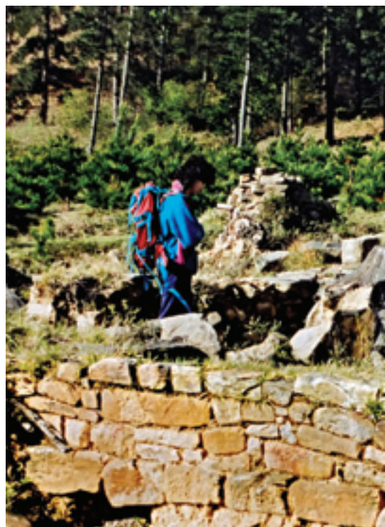
Memaiaiko baselizaren aztarnak