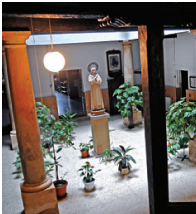
📍 Santa Anako komentua

parrokia eginkizuna hartu zuen (kalonje batzuk bizi ziren bertan), eta ermita ugari zituen bere menpean. Eraikin haren ordez eliza erromanikoa egin zuten XII. mendean, eta XVI. mendearen hasieran gaur eguneko eliza gotikoari eman zioten hasiera. Elizarekin batera San Martin eta Santa Marina kapera funerarioa egin zuten kanpoaldean. Tradizioaren arabera, kapera horretan jarri zituzten gerora kondeen momiak.